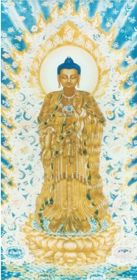
道證法師敬繪之阿彌陀佛聖像