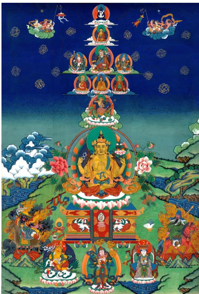
敬禮 普賢王如來壇城法脈傳承 上師、本尊、空行、護法聖眾海會前 第 11 頁