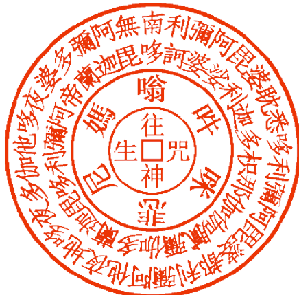
往生咒與解冤咒聖符

解冤咒 唵齒臨金吒金吒僧金吒吾今為 汝解金吒終不為汝結金吒唵強 中強吉中吉波羅會上有利一 切冤家離我身摩訶般若波羅密