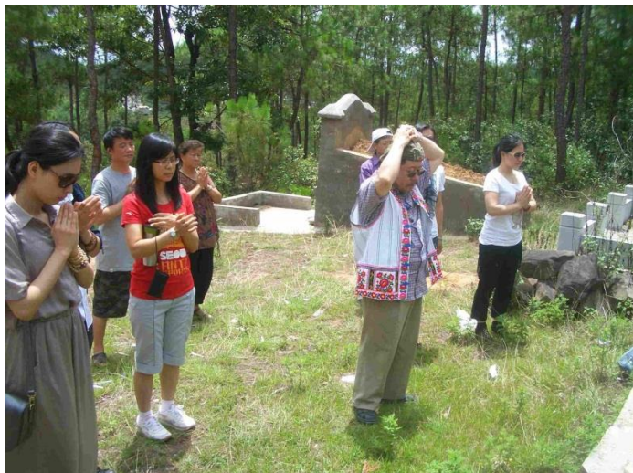
林上師修三身頗瓦法超幽