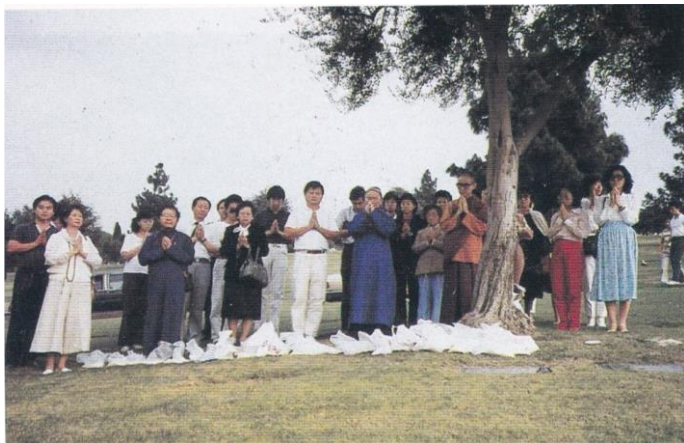
陳祖師在尸林超幽